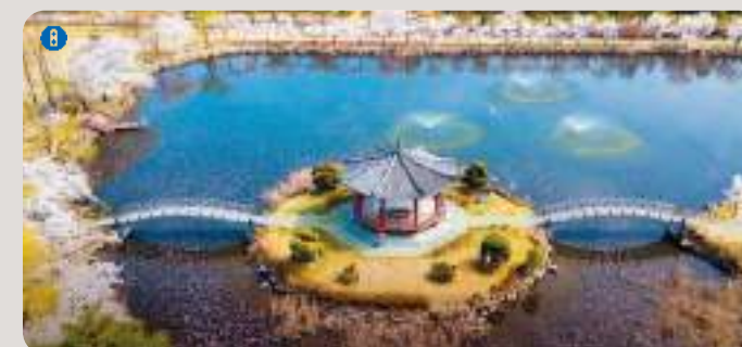
8 호국정 | 호국정신 계승을 위해 1983년 건립된 정자로 수목이 잘 조화된 한국형 정원화 호수인 호국정