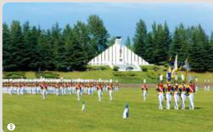
9 흥성연병장 | 동양 최대규모, 10개의 축구장 규모 102,310㎡(31,100평)의 잔디 연병장으로 육군3사관학교의 상징

리더의 능력과 자부심을 고취시킬 수 있는 최고의 프로그램과 최상의 첨단 교육 시설 및 장비 , 여가를 위한 각종 편의시설 과 레저, 스포츠 시설 을 완벽히 갖추고 있습니다.