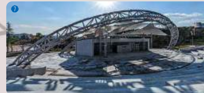
7 KAAV광장 | 약 3천여명을 수용할 수 있는 대규모 행사를 위한 공간으로 학생들의 공연과 학교의 대표적인 행사들이 열리는 화합과 힐링의 장소