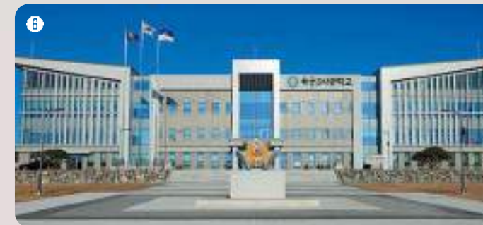
6 본관 | 학교 발전의 중심으로, 효율적이고 체계적인 환경을 제공하며 학교의 비전과 목표를 실현하기 위한 모든 계획이 시작된다.