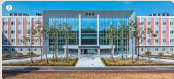
2 3층용관 | 최신 설비와 쾌적한 주거 공간을 제공해 학생들이 학업과 훈련에 전념 할 수 있도록 설계된 공간