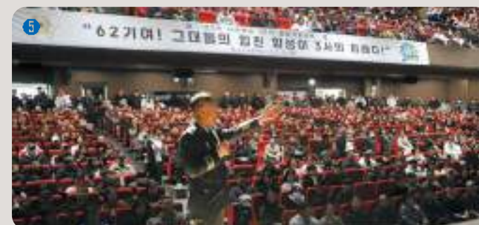
5 흥성관 | 약 1,300석 규모의 실내 공연장으로 학생들과 간부들이 다양한 공연과 행사를 통해 문화적 소양을 높일 수 있는 공간