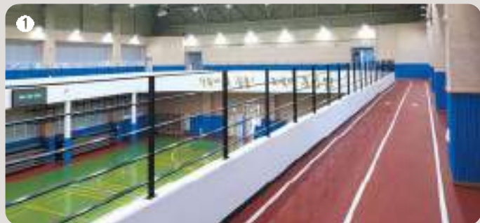
1 단식관 | 농구, 배드민턴, 테니스, 크로스핏 전용실, 조깅 트랙 등이 있는 다목적 체육관