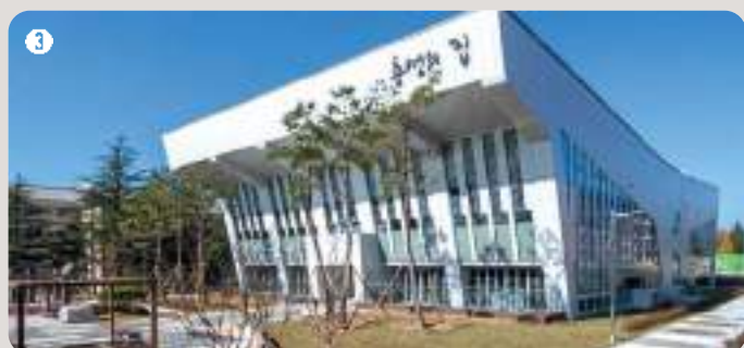
3 흥성의 집 | 여가와 휴식을 위한 시설들로 학생들의 복지와 재충전을 돕는 공간