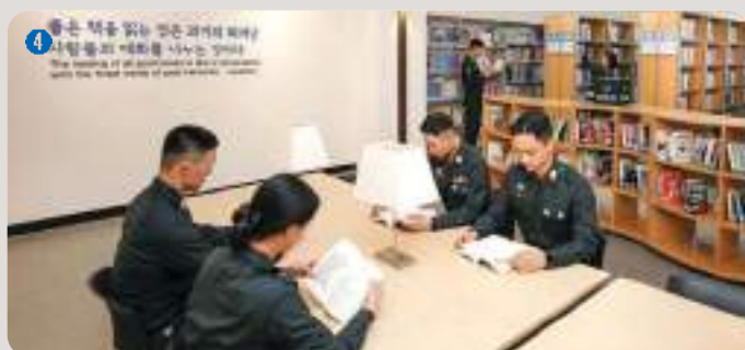
4 도서관 | 500평 규모 RFD(무선인식) 기반으로 운영되며 북카페 형태의 인테리어로 총 15만 권의 장서를 보유한 학습공간이자 종합문화공간

과학적이고 논리적인 사고와 합리적인 의사결정 능력을 갖추기 위한 스마트한 교육환경 과 최적의 교육지원 체계 구축